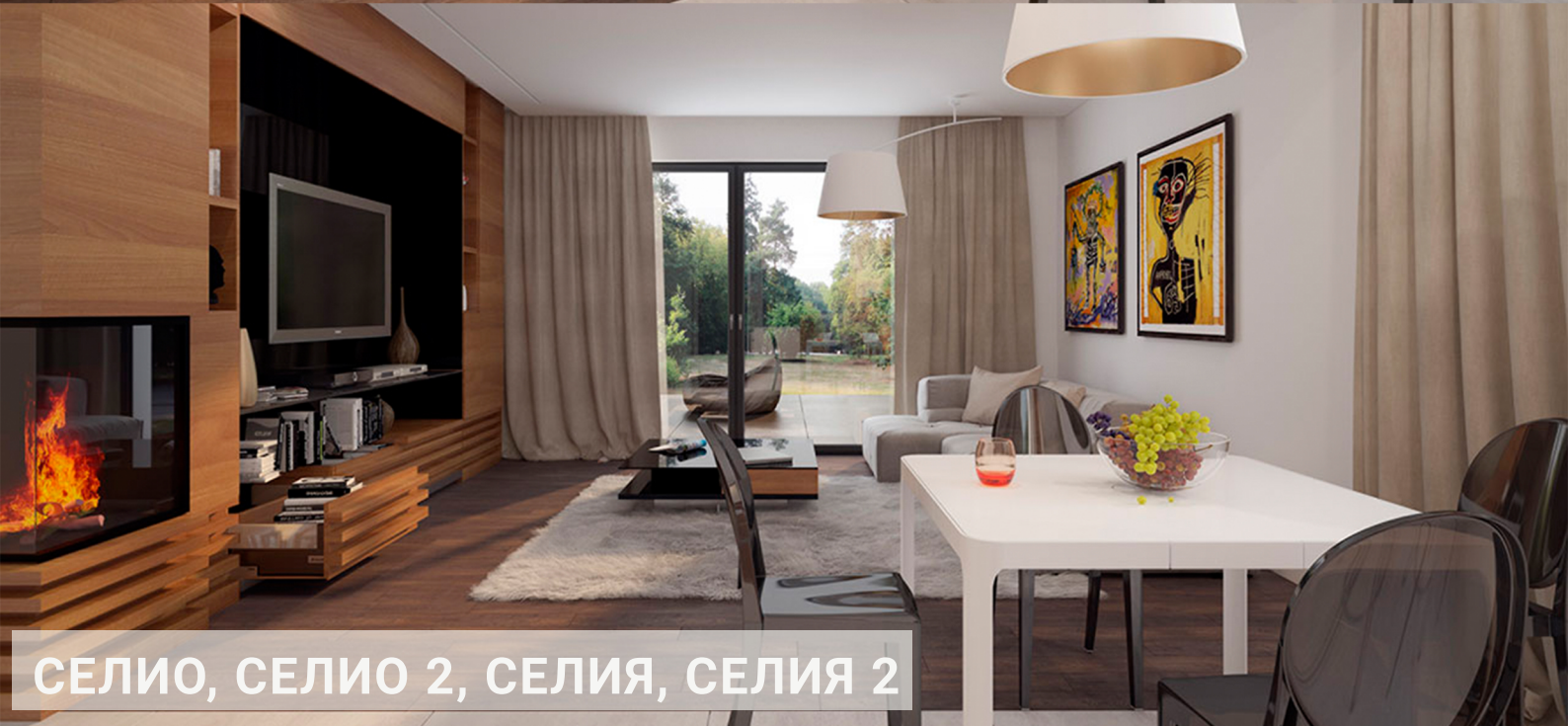
СЕЛИО, СЕЛИО 2, СЕЛИЯ, СЕЛИЯ 2